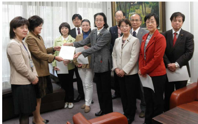
池戸女性活躍・男女共同参画担当理事(左から2人目)に申し入れを手渡す日本共産党横浜市議団=11月20日、横浜市役所

申し入れでは、男女間賃金格差の是正の取り組みを重点施策として明確に位置づけ、具体的な事業を定めること、保育所・学童保育・高齢者福祉の充実、中学校給食の実施、小児医療無