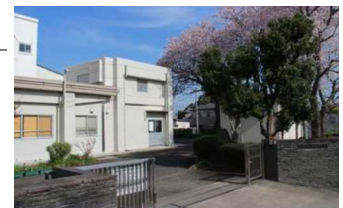
上菅田小学校（同校HPより）