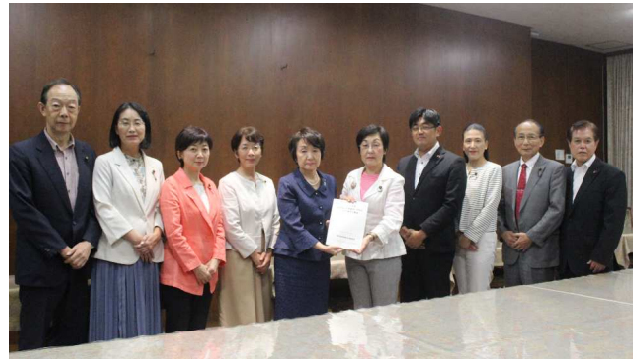
林市長に要望書を手渡す党市議団=9月11日