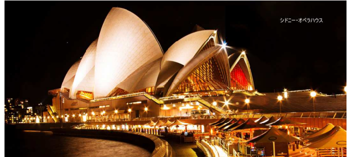
シドニーのオペラハウス

視察したあらかし由美子党市議団長は、「市長のいうオペラ・バレエ上演の劇場を整備してうまく行く保障はあるのか。なぜこんなに急いで決めるのか。今はコロナ対策など市が全力で取り組むべき時」とコメントしました。