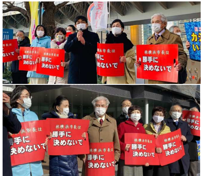
市役所前でのアピール行動

この運動は、夏に行われる市長選挙のたたかいつながるはずですが、ここに確信と展望を見出すことができます。