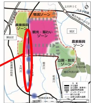
↑旧上瀬谷通信施設土地利用基本計画より