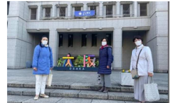
大阪市政府本庁舎前