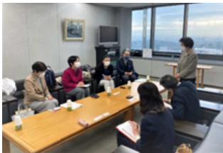
堺市教育委員会との懇談