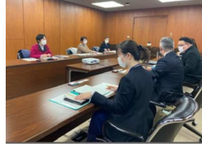
大阪市教育委員会との懇談