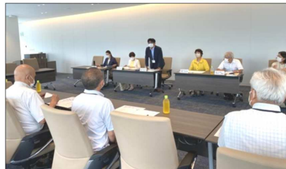
7/14 横浜市精神障害者地域生活支援連合会