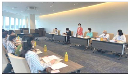
7/13 新婦人横浜18支部連絡会