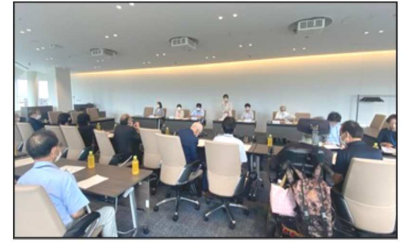
7/12 横浜市身体障害者団体連合会