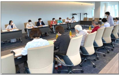
7/13横浜市精神障害者家族連合会