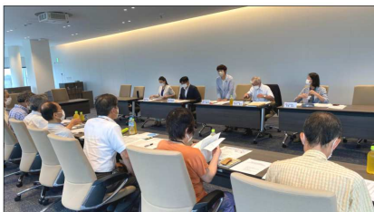
7/15 神奈川・横浜の夜間中学を考える会