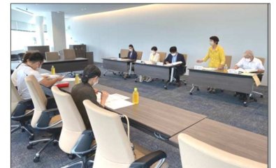
7/14 よこはま無認可・認可保育所手つなぎ協議会