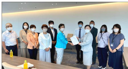
7/19 横浜市私立保育園こども園園長会