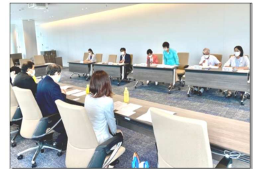
7/13 神奈川県保険医協会横浜支部